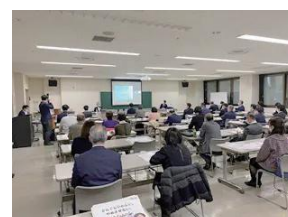
特別講師によるオンライン・オフライン無料研修