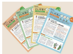
毎月最新の情報をNewsとしてお届け