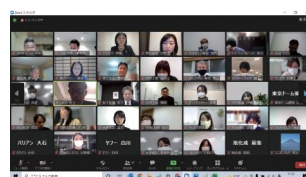
企業同士の情報交換オンライン会議の様子