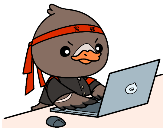
みやぎハローワークキャラクター ガンちょーさん