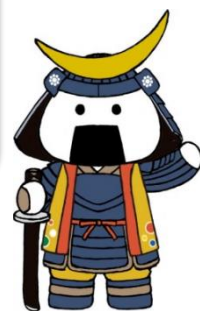
仙台・宮城観光PRキャラクター むすび丸

沿岸部に事業所を構える中小企業者のみなさま！ 労働者の新たな雇入れには本助成金をご活用ください！