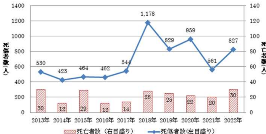
職場における熱中症による死傷者数の推移 全国

7月は、 クールワークキャンペーン の重点取組月間です。体が暑さに慣れていないと気温が高くない時期でも熱中症になる場合があります。「暑熱順化」等により熱中症を予防しましょう！