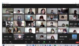
企業同士の情報交換オンライン会議の様子