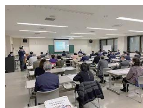
特別講師によるオンライン・オフライン無料研修