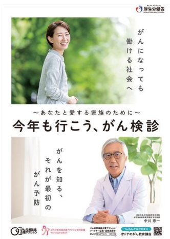
社内掲出用のポスターを無料でプレゼント

無料でも、ここまでできる会社のがん対策！ 「がん対策推進企業アクション」に登録しましょう。