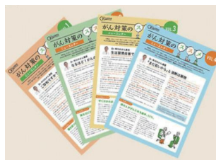
毎月最新の情報をNewsとしてお届け