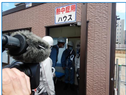
クーラーがよく効いた熱中症ハウスを確認しました。