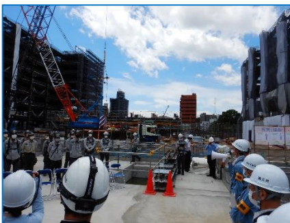
毛利局長から職長会の皆さんに激励の声を掛けました。