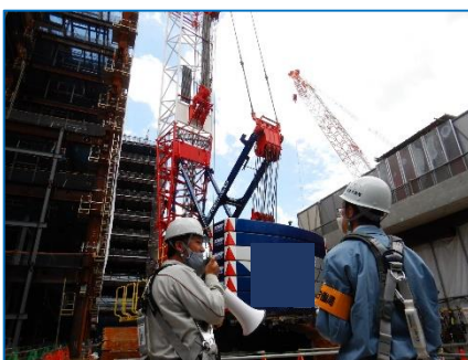
作業所長からクレーン等の説明を受ける毛利局長。