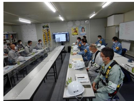
東北支店長以下現場の皆さんに向け千葉署長からの総評。

令和3年の宮城県内の建設業の死亡者数は6月末で3名と前年同期に比べて増加しており、パトロールでは、墜落・転落防止、クレーン等災害防止の実施状況を点検したほか、熱中症予防対策、新型コロナウイルス感染症防止対策の状況も確認しました。