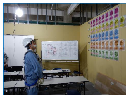
打合せや教育に使われる会議室を視察しました。