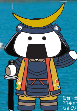
仙台・宮城観光 PRキャラクター むすび丸