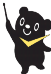
最低賃金制度のマスコット チェックマン