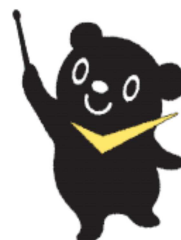
最低賃金制度のマスコット チェックマン

詳細は宮城労働局労働基準部賃金室（022-299-8841） 又は最寄りの労働基準監督署にお問い合わせ下さい。