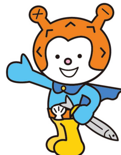
気仙沼市観光キャラクター