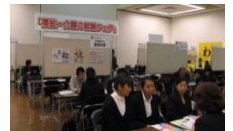
就職フェアの様子