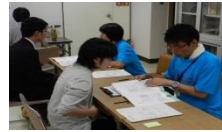
専任の福祉のプロがサポート