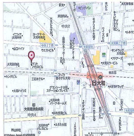
小田急線 相鉄線 大和駅より徒歩5分

給 与: 時間給、諸手当、有給休暇を含む総支給額 福 利 費 等: 健康保険、介護保険、厚生年金、雇用保険、労災保険、健康診断等 会社運営費: 人件費、オフィス、事務経費、募集広告費等会社運営にかかる諸経費 営 業 利 益: 上記経費を差引いた会社の利益