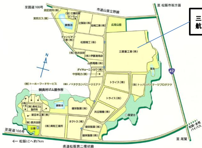
■ 松阪中核工業団地区画図

中途採用者就職面接会の参加企業は、決定次第、松阪市ホームページ・三重労働局ホームページ等でお知らせいたします。