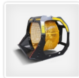
(回転式選別バケット)

問23 道路破碎機は、新しい解体用機械には含まれないとの見解もあるが、小割機と酷似したアタッチ