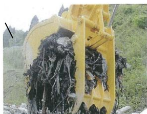
出展: (株)室戸鉄工所HPより