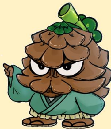
あわてず まつぞう

5月号でもお伝えいたしました が、6月に入り気温が急激に上昇 しており、各地で熱中症のニユー スが報道されています。今一度、 暑熱順化、作業内容の見直し、水 分補給など、早めの熱中症対策を 講じてください。