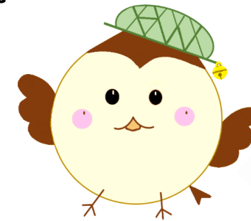
ハローワーク鈴鹿 就職応援キャラクター 『ハロちゅん』

◎ ハローワークでは随時紹介を行っており、すでに決定済となっている場合がありますので、ご了承ください。