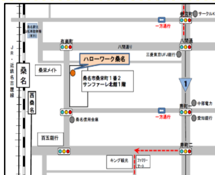
【説明会会場】 JR・近鉄桑名駅 徒歩2分