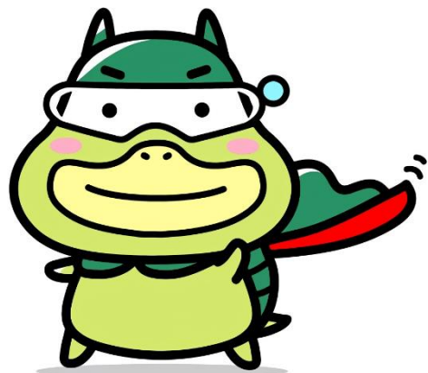
労働基準局広報キャラクター「たしかめたん」