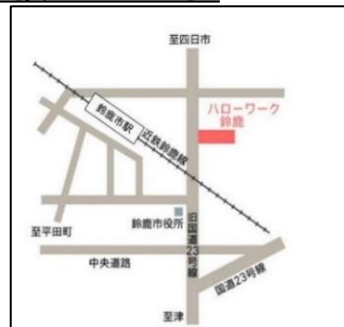
【説明会会場】近鉄鈴鹿市駅徒歩3分