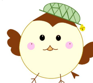
ハローワーク鈴鹿 就職応援キャラクター 『ハロちゅん』

◎ ハローワークでは随時紹介を行っており、すでに決定済となっている場合がありますので、ご了承ください。