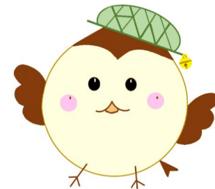
ハローワーク鈴鹿 就職応援キャラクター 『ハロちゅん』

ずいじょうかい おこな けつていずみ ばあい りょうしょう ◎ ハローワークでは随時紹介を行っており、すでに決定済となっている場合がありますので、ご了承ください。