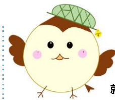
ハローワーク鈴鹿 就職応援キャラクター ハロちゃん