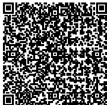
津市 《看護師・准看護師》