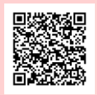
募集中の訓練一覧はこちら