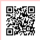
訓練について詳しくはこちら

【お問合せ】 ハローワーク桑名 ☎ 0594-22-5141 (訓練担当41#)