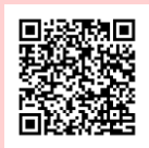
最新の学校説明会はこちら