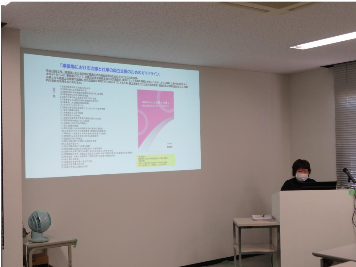
事業場における治療と仕事の両立支援のためのガイドライン、企業・医療 機関連携マニュアルの説明 （三重産業保健総合支援センター 上住産業保健専門職）