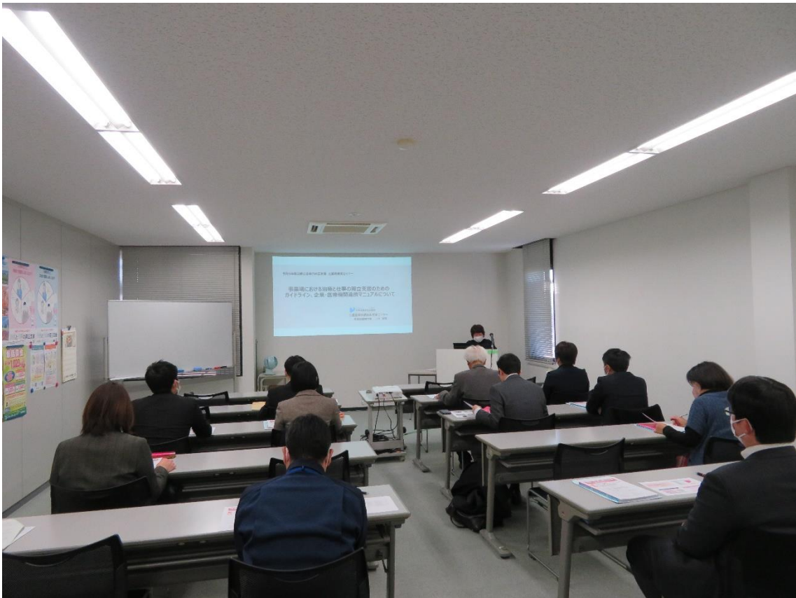
セミナーの会場参加者の様子