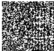
津市 《看護師・准看護師》