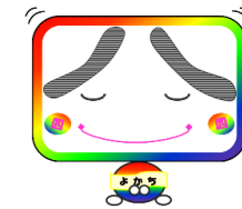
ハロー◇よかち (ハローワーク四日市イメージキャラクター)

◎ ハローワークでは随時紹介を行っており、すでに決定済となっている場合がありますので、ご了承ください。