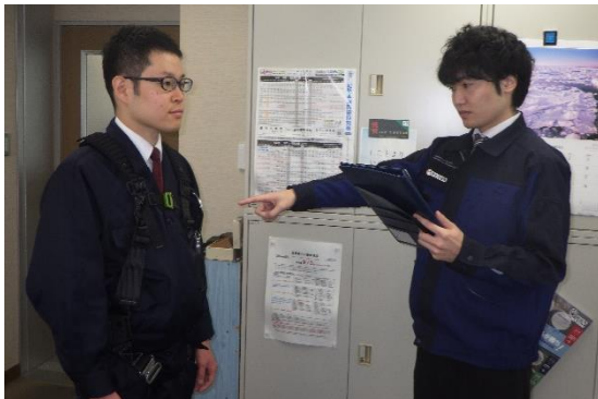
※フルハーネス型墜落制止用器具の着用点検