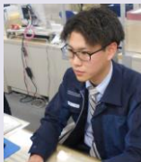
津労働基準監督署 西田 監督官 令和5年度任官