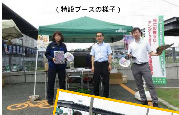
（特設ブースの様子）

当署では、引き続き FC. ISE-SHIMA と連携し、労働災害防止のための取り組みを行っています。会場で上映した動画は、YouTube にも掲載していますので、ぜひご活用ください。