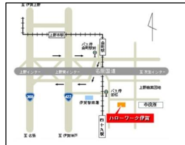
【説明会会場】四十九駅より 徒歩10分