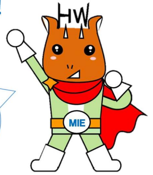
就職応援戦士 わかもちゃん