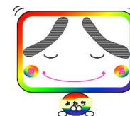
ハロー◇よかち (ハローワーク四日市イメージキャラクター)