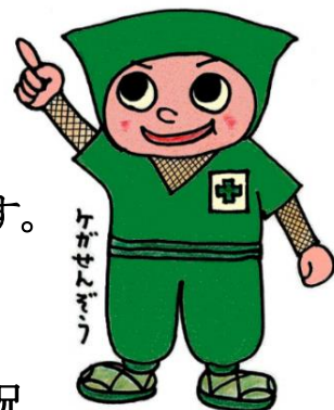
伊賀署 建設業に係る労働災害発生状況 (休業4日以上)

伊賀労働基準監督署管内において、建設業における労働災害は、平成30年以降増加傾向にあります。中でも、墜落・転落災害が最も多く、直近5年間で34の方が墜落・転落災害に遭われているほか、うち4人が残念ながら亡くなられています。墜落・転落災害を防止するため、高所作業を行う前に裏面のチェックリストの確認をお願いいたします。