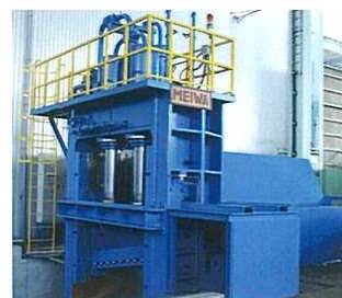
ワイドプレスシャー