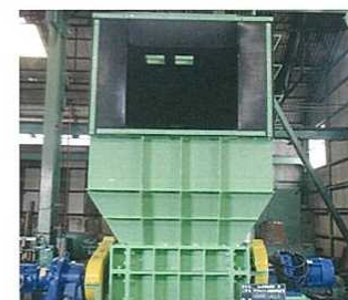
2軸剪断式破砕機 (電動機駆動式)