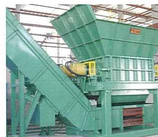
2軸剪断式破砕機 (油圧駆動式)