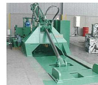
ベアリングプレス (三方締タイプ)