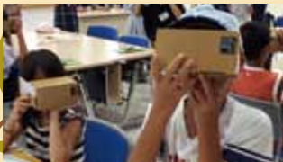
認知症フレンドリーキッズ講座 & VR体験