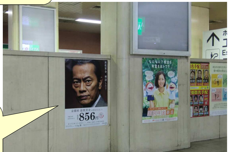
烏丸線 四条駅 南改札前、階段壁面