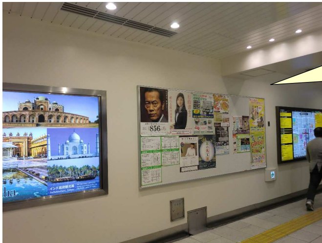
烏丸線 京都駅 南北通路前掲示板部