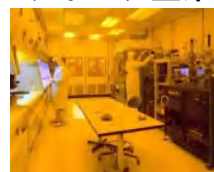
半導体工場での仕事風景