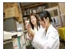
研究開発の仕事風景