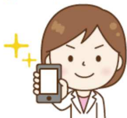
スマホ対策済のサイト構築 (HTML&CSS)

時代のニーズに応じて、スマホやタブレットに対応したデザインにする方法を学びます。