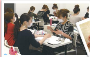
授業風景 (相モデルでの実技)