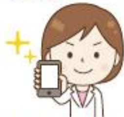
スマホ対応のサイト構築 (HTML&CSS)

時代のニーズに応じて、スマホやタブレットに対応したデザインにする方法を学びます。