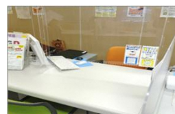
カウンセリングブース