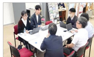
学生交流スペースでの学生と社会人との交流（イメージ）

より幅広い学生の利用を促すため、学びや交流の場として自由に利用できるフリースペースを設置するとともに、企業にとっても学生と直接交流できる場として活用を促進。従来の個別支援等に加え、学生と企業の相互理解を深め、新たなマッチング機会を創出。