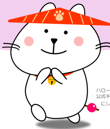
ハローワーク西陣 公式キャラクター にしじんまる