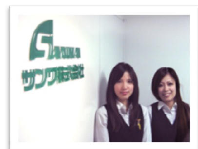
納得のいく転職をバックアップ！