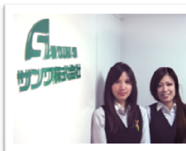
納得のいく転職をバックアップ！