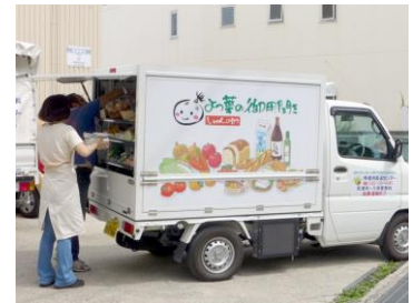
移動販売車“旬の助”

○安全・安心な食べものをご家庭にお届けする関西よつ葉連絡会のメンバーが多数で、互いに協同して活動を支え合う仲間です。