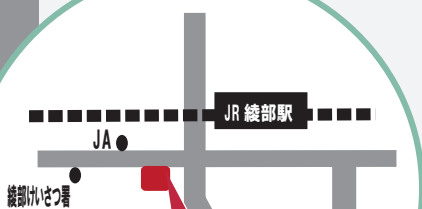
ハローワーク綾部

採用を勝ち取るための面接攻略法 150分 面接時のマナーや、ポイントをご説明しグループ ワークでの模擬面接を行います。