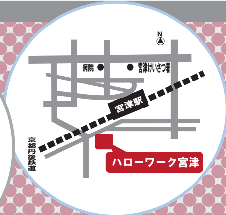
ハローワーク宮津