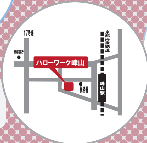
ハローワーク峰山