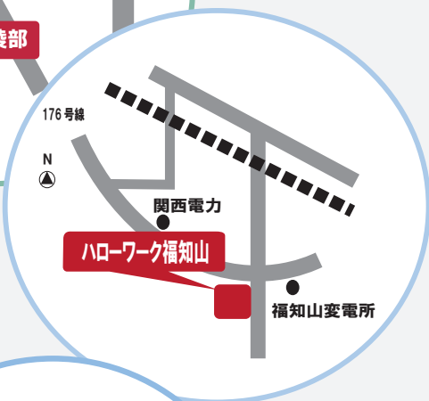
ハローワーク福知山