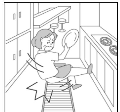
足を滑らせて転倒