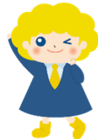
パートタイム・有期雇用労働法 キャラクター「ハゆう」ちゃん