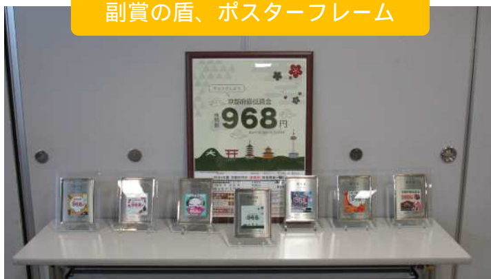
副賞の盾、ポスターフレーム