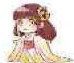
京都労働局 御池ちゃん